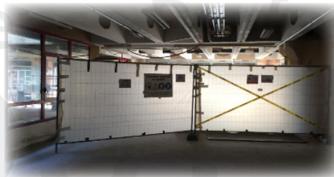
Confinement d'une zone à désamianter.

Une partie de la première tranche des travaux sera livrée d'ici fin octobre ; elle concerne la réception des menuiseries extérieures, des sanitaires, des chauffages et la réfection de l'amphithéâtre du bâtiment B.