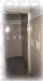
Sanitaires refait à neuf

Le désamiantage des locaux, qui avait été à l'origine de retards, est achevé. Fin novembre, l'ascenseur et l'escalier devraient être terminés (Bâtiment B). Ces aménagements sont les préambules à la mise en place du nouvel accueil.