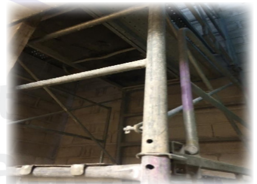
Préparation des travaux pour la cage d'ascenseur.

La seconde tranche a pour but de redéfinir les espaces et éventuellement de les re-cloisonner, légalement, les bureaux doivent avoir une surface minimum de